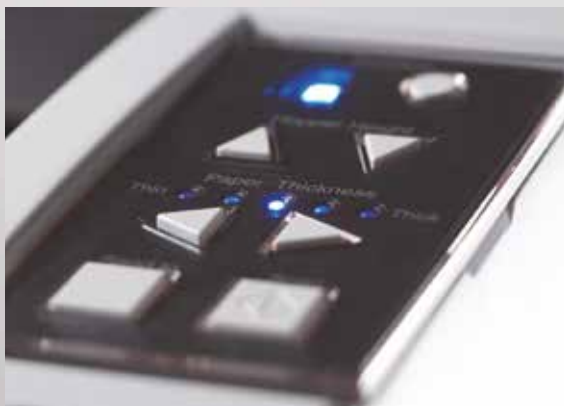
Встроенная панель управления

Интеллектуальная функция распознавания склеившихся листов обеспечивает применение таких параметров сканирования документов, благодаря которым можно настраивать датчики таким образом, чтобы они распознавали и игнорировали приложенные материалы, такие как наклейки или документы с прикрепленными фотографиями, которые в противном случае вызвали бы прерывание процесса сканирования. Функции автоматического распознавания размера листа и определения цвета позволяют сканировать партии документов, в которых содержатся листы разных размеров и с разным цветовым фоном, и получать высококачественные изображения без необходимости заранее располагать их в определенном порядке.