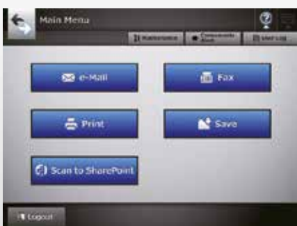
Экран главного меню