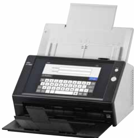
A4 книжный с разрешением 300 тч дюйм 25 стр./мин / 50 обр./мин Сканирование смешанных пакетов объемом до 50