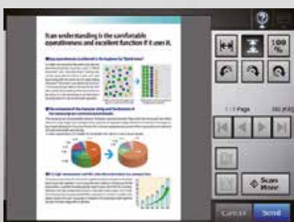
Экран предварительного просмотра (Scan viewer)